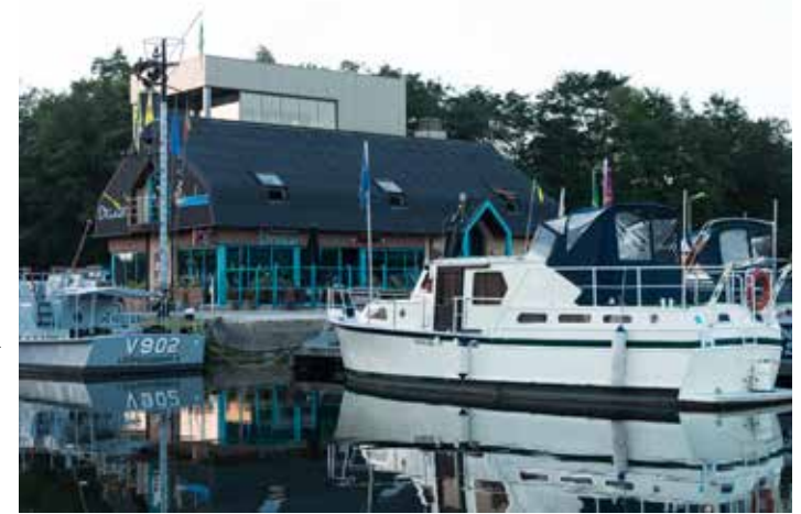
▲ Zal de jachthaven veel voordelen ondervinden van de acties en evenementen die betaald worden met promotaks?

Of toch niet? Want zelfstandige uitbaters van cafetaria's van gemeentelijke accommodaties betalen de promotaks helemaal niet, ontdekte de N-VA. Terwijl dit volgens ons toch ook commerciële zaken zijn die vaak meer dan vele anderen profiteren van activiteiten in het centrum. Toch moeten ook een jachthaven, een frituur, een kapper, een manege of een tennisclub de taks betalen, hoewel zij veel minder het effect zullen voelen van de promotie-acties.