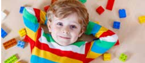
N-VA organiseert speelgoedactie p.2