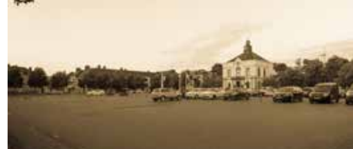
Koningin Astridplein moet meer bruisen p.3