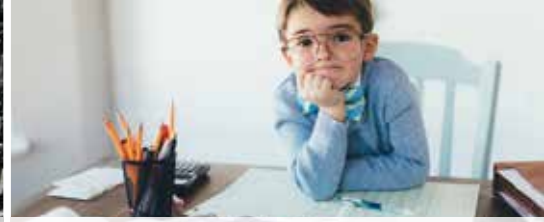
Wie is het kind van de (gemeente)rekening? (p. 3)